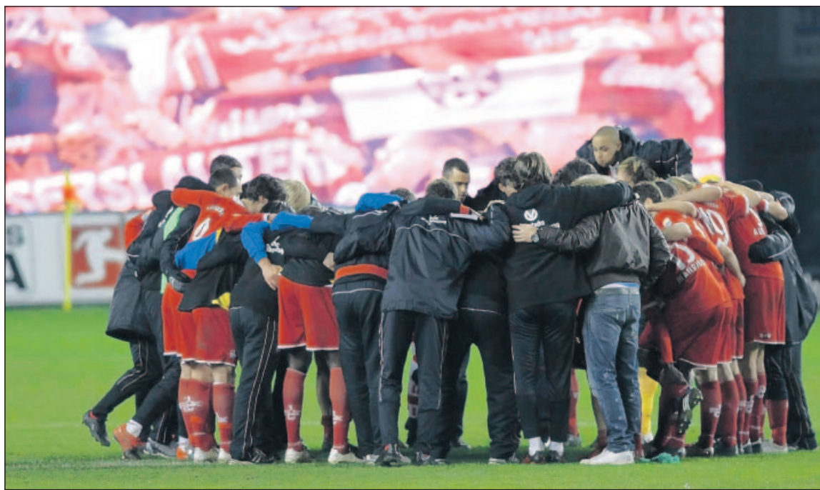
Geschlossenheit demonstriert der Kreis nach dem 3:0-Sieg des 1. FCK im letzten Heimspiel der Hinrunde gegen die TuS Koblenz.

Barbarossastadt. Erst vor wenigen Wochen ist der einstimmige Beschluss im Stadtrat zur Fusion von